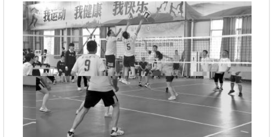
5H29 I ,J KLMNOPQR,STUVMNWR,XYMNZR[ KLMN \ ] ^ _ OaUVbcdefghijkl.mnopqr,mnsop,NtF u,mnsopvwx,OPQyFz{,XYMNNt,STUVMNNt} },X YMNsnT~* !y"#$%&' (#) * + " #, $%JSTUVMNsn T O1Q, .- .bc/O161_`O+2344h56b7,8h9; ; <=>,?) * @AB56[ CD,EF[ GHI J,KL; MNOPQRST[ U+5V,WXR Y)*, Z[ [w, \B] ^ [L_b7, `ab+cdef,XYMNg(hf, \i Mj MMN9(kf. l mnQoMN(pqr s#, tuOvMN,wxMN ( XYzyez#. Fu{ | KLMN\ ] ^ _ OaUVbc) ~. !. STUVMN NOP[ j 6x Q* , , rs R M =, [ aUVc , , [ Z, ; ; [ F; <, ( $/23 ( / u ) X, ; g, . )