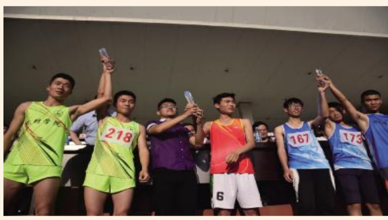
! 片作者:江东昌 束晓童 吴慧敏 ABC > 智豪