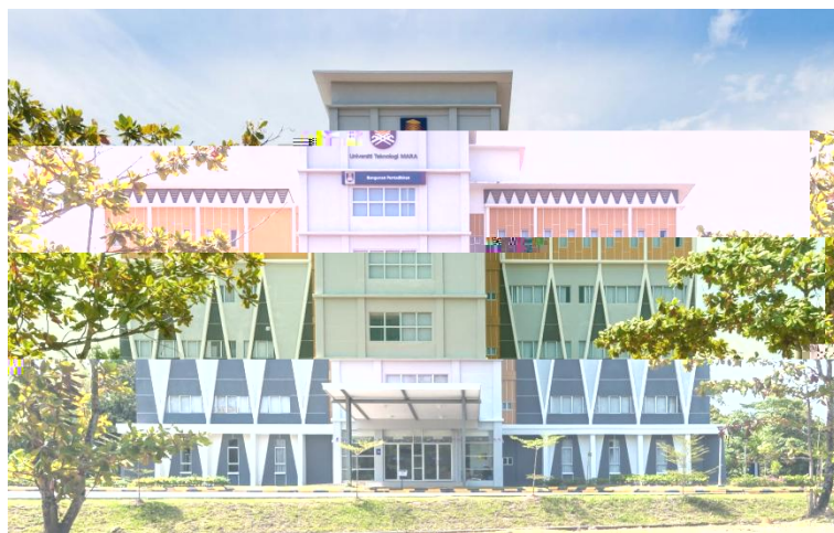
Administration Building / Rectorate