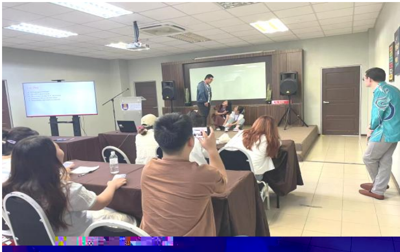
English Enrichment Course Class