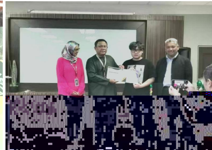
Certificate of Completion Grant