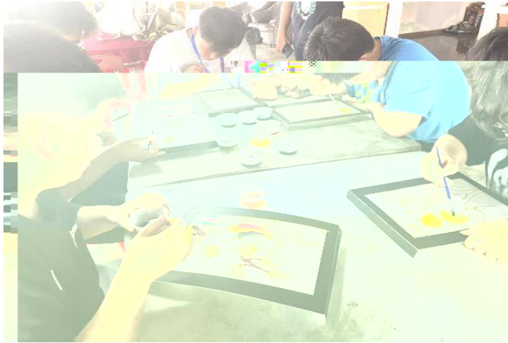
Experience Wax Painting&Drawing